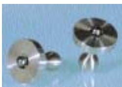
À droite : Boutons de manchettes signés Ingrid Bärndal, 2002.