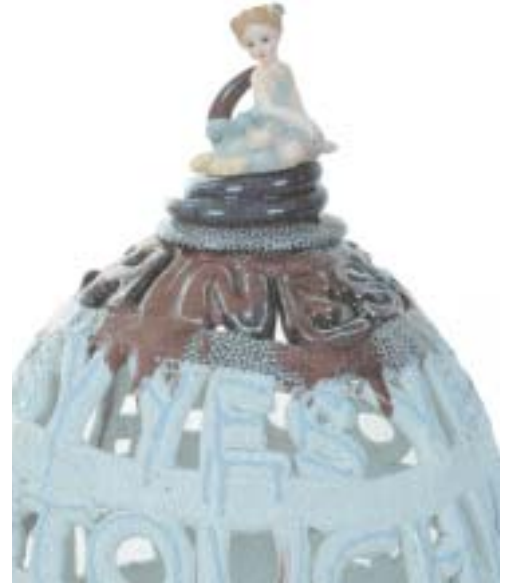
Les céramiques d'Eva Bengtsson ne cessent de fasciner. Les lettres de l'alphabet jouent souvent un rôle important dans ses compositions.