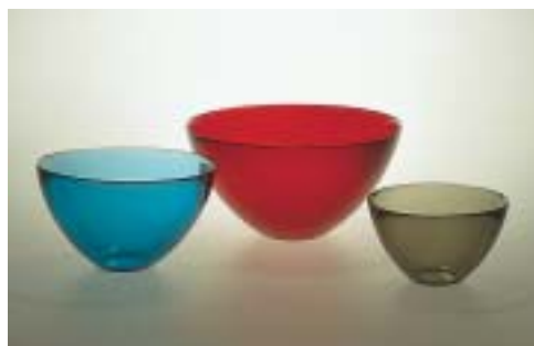
Les coupes de verre « Fuga », créées par Sven Palmqvist, 1953, ont été présentées à l'exposition H55 en 1955. Elles étaient fabriquées selon un procédé nouveau. La pâte de verre, placée dans un moule rotatif, était repoussée sur les bords par la force centrifuge.