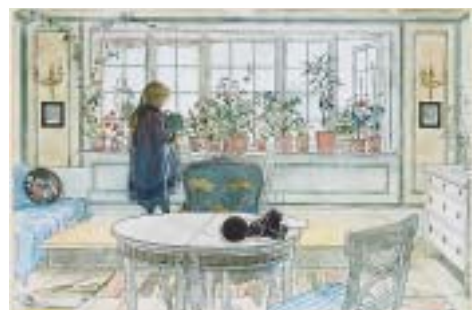
Les aquarelles de Sundborn, Dalécarlie, la demeure de Carl Larsson, restent aujourd'hui encore l'image de ce qu'il y a de plus suédois. « La fenêtre aux fleurs », 1894.