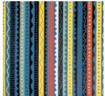
Textile imprimé de la collection « Lek » de 10-Gruppen, 1980. Design Susanne Grundell.