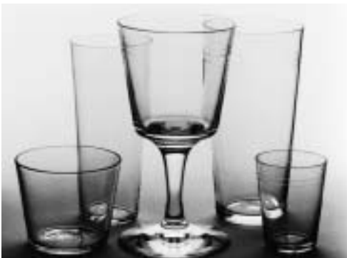
À gauche : Verres « Strof », dessinés par Ingegerd Råman pour Skruvs Glasbruk, 1991.