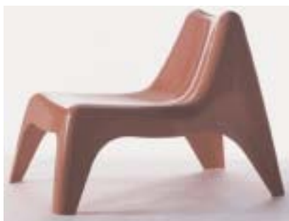
Ikea est un nom suédois qui fait référence. Dans sa dernière collection PS (2002) figure ce fauteuil de plastique, « Vågsö », dessiné par Thomas Sandell.