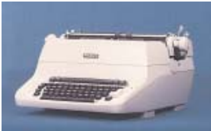
Machine à écrire des années 50, design Bernadotte & Björn, pour Facit. Sigvard Bernadotte a ouvert très tôt sa propre agence de design. Lui-même s'intéressait à tout, depuis les produits industriels jusqu'aux bijoux et aux éléments de décoration intérieure.