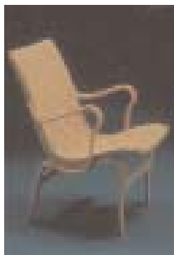
Siège « Eva », design Bruno Mathsson, 1941. Devenu un classique, ce modèle est encore produit de nos jours.