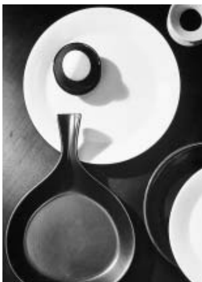
Le service « Terma » a été adopté par bien des foyers suédois. Design Stig Lindberg, 1958.