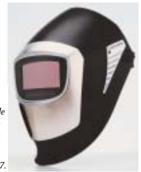
À droite : « Speedglas® 9000 », casque de soudeur de Carl-Göran Crafoord, Ergonomidesign. Prix du design européen en 1997.