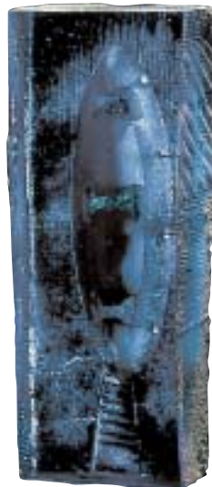
À droite : Le bleu est une couleur fréquente dans les sculptures de verre de Bertil Vallien. « Destination II », 1992.