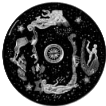
« Swedish Grace »: Plateau de verre. « Rose des vents », Simon Gate, 1925.