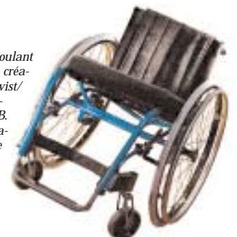
Act, fauteuil roulant actif en titane, création Bo Lindqvist/Hubert Malmström, Etac AB. Léger et maniable, il peut être manœuvré sans aide par l'utilisateur.