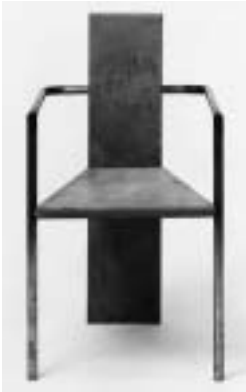
« Concrete », siège en acier et béton de Jonas Bohlin (1983), a été à l'origine d'un débat encore en cours dans le monde du design sur la raison d'être de la fonction et sur la frontière entre art et design.