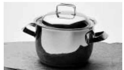
Sigurd Persson, créateur aux talents multiples, travaillait dès les années 50 comme orfèvre, sculpteur et styliste industriel. La série de casseroles en acier inoxydable « Gunda » (1978) révèle autant sa manière sculpturale que son sens du matériau et des détails fonctionnels.