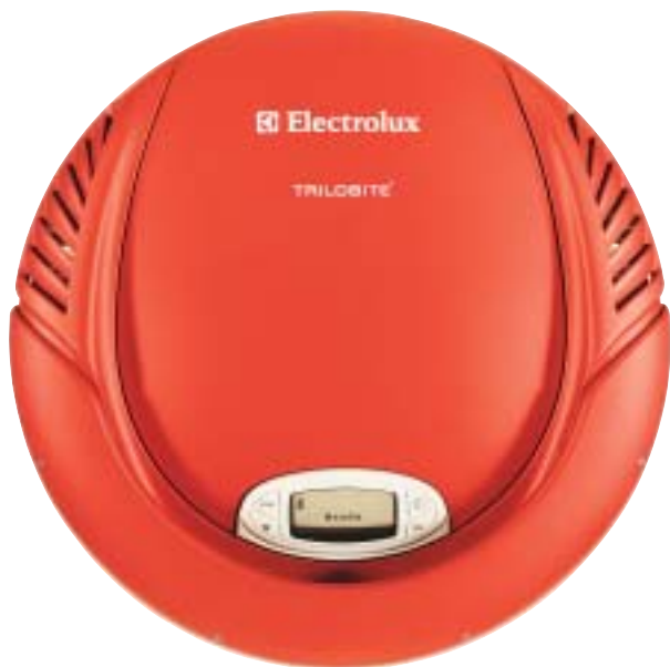
« Trilobite », l'aspirateur robot d'Electrolux dessiné par Inese Ljunggren, a été récompensé par un diplôme Utmärkt Svensk Form pour 2002.