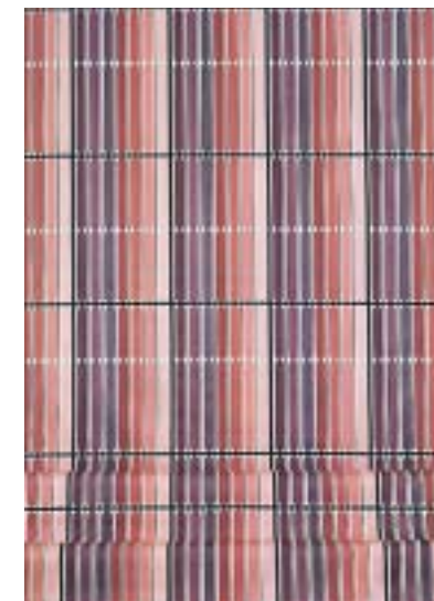
Textile imprimé « Windy Way », design Astrid Sampe, 1954. Les textiles d'Astrid Sampe ont orné beaucoup d'intérieurs suédois.