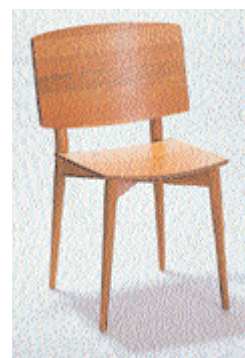
Récompensé par un prix, le siège « Oak » de Jonas Lindvall édité par Skandiform est un exemple de design suédois d'inspiration classique de ces dix dernières années.