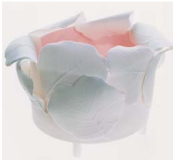
Des formes organiques gracieuses dessinent une coupe montée sur des pieds légers. Céramique de Mari E. Göransson, 2002.