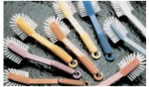
Variante originale d'une brosse à vaisselle souvent plagiée. Dessinée par A & E Design pour la firme norvégienne Jordan, 1975.

La foi dans le progrès a perdu du terrain dans les années 1960 et 70, y compris dans le domaine du design. La conscience des ressources limitées de la planète, l'évolution du climat politique et d'autres facteurs ont changé la situation des designers industriels aussi bien que des créateurs indépendants. L'exigence d'une production respectueuse