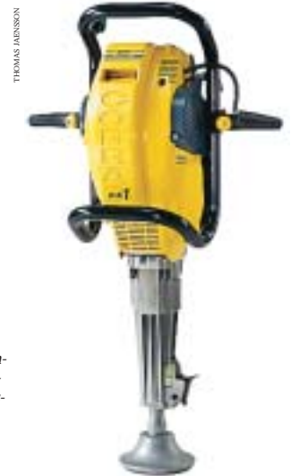
Marteau pneumatique « Cobra mk 1 », design Björn Dahlström, 1997, pour Atlas Copco. Une innovation technique dotée de nombreux détails intéressants au plan du design.