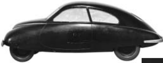
Bijoux d'argent aux ondulations organiques de la fin des années 70, design Torun Bülow-Hybe.

Prototype de la classique Saab des années 40, design Sixten Sason. Sorti des usines en 1952, ce modèle a été produit, avec des modifications minimales, jusque dans les années 70. Cette voiture aux formes aérodynamiques est maintenant un objet culte, en voie de devenir une rareté pour les collectionneurs de voitures anciennes.